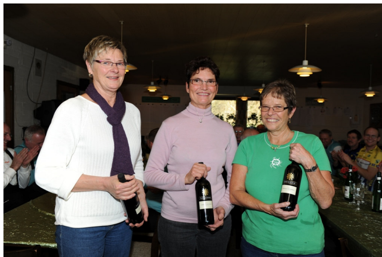
De tre flinke damer der havde styr på suppen.